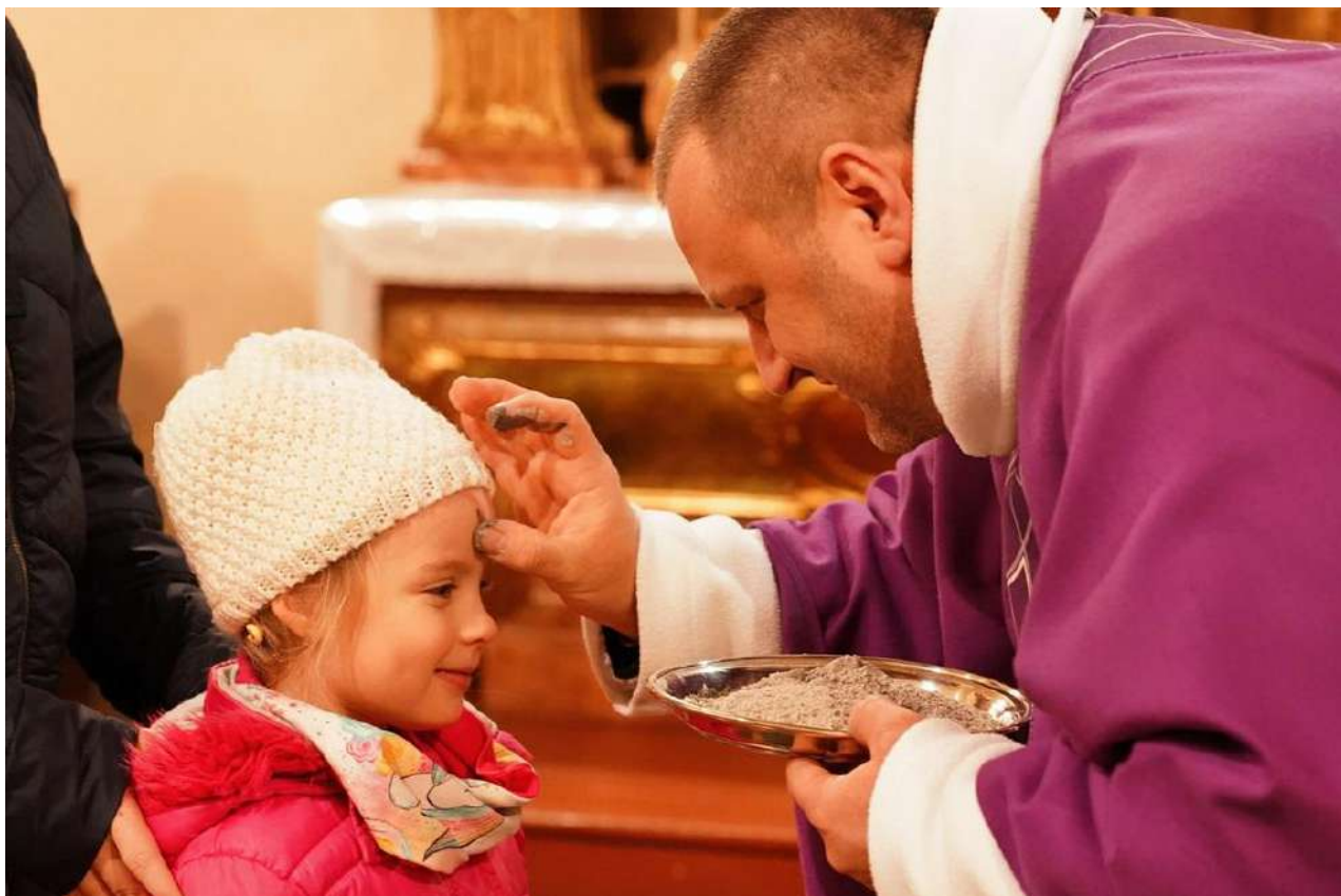
Z Popeleční středy 18. 2. 2026