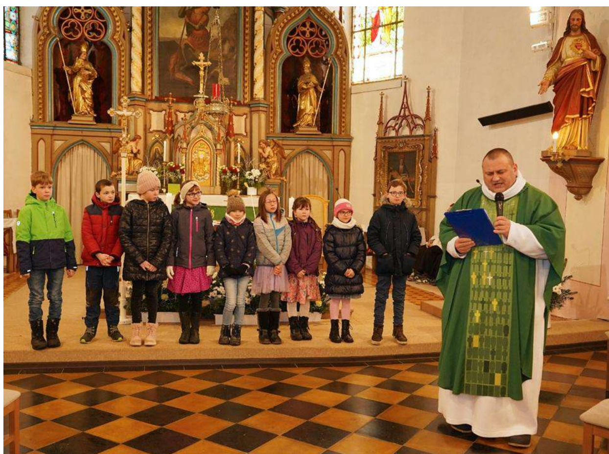
Představení dětí připravujících se ke svátostem (NE 15. 2. 2026 v DČ)