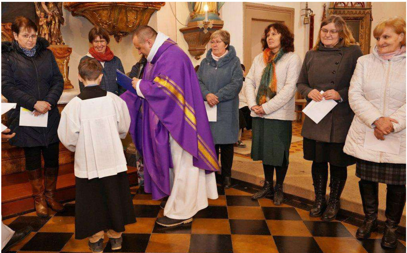
Představení a ustanovení nové pastorační rady farnosti na závěr mše v neděli 1. 3. 2026 v DČ 😊