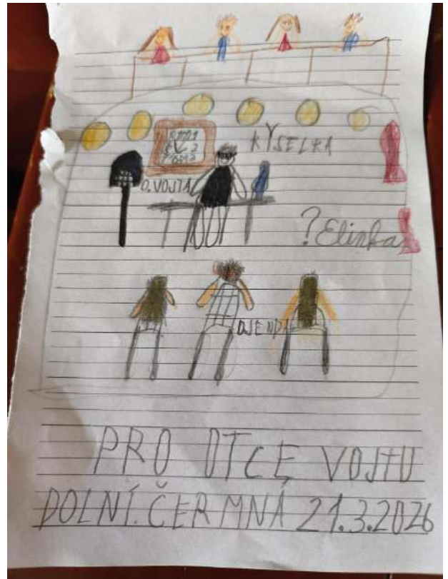
Naše farní postní duchovní obnova zachycena nejmladší účastnicí 😊