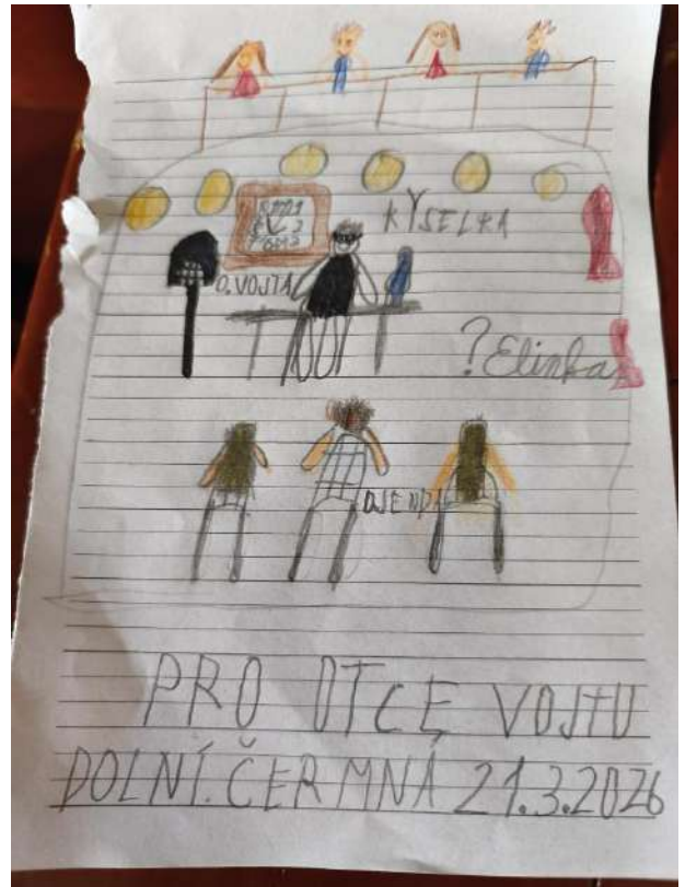
Naše farní postní duchovní obnova zachycena nejmladší účastnicí 😊