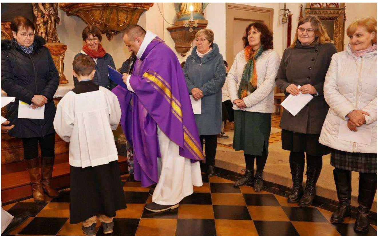
Představení a ustanovení nové pastorační rady farnosti na závěr mše v neděli 1. 3. 2026 v DČ 😊