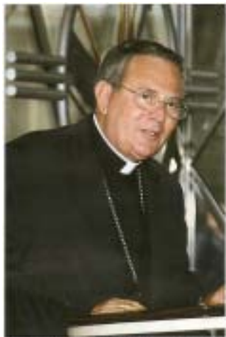
Foto: Ing. Petr Štěpánek, BŘS, agentura v rámci Anatólie a předseda Turecké biskupské konference, biskupství 3. června 2010.