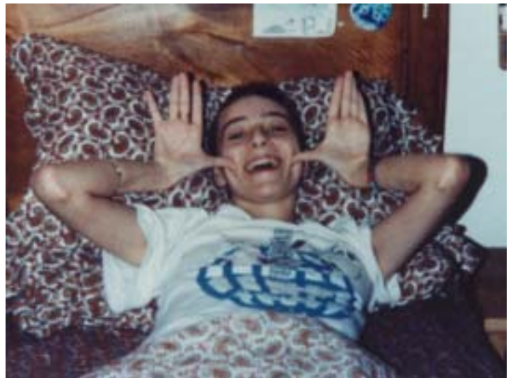
Chiara Luce Badano v době své nemoci.